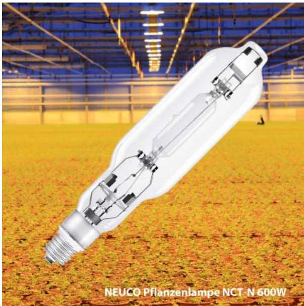
NEUCO Pflanzenlampe NCT-N 600W

NEUCO Pflanzenlampen NCT-N garantieren ein schnelleres und qualitativ hochwertigeres Wachstum in allen Entwicklungsphasen und sind damit ein Garant für kompakte und kräftige Pflanzen. Die Halogen-Metaldampflampen bieten eine effektive Lichtleistung während der gesamten Lebensdauer.